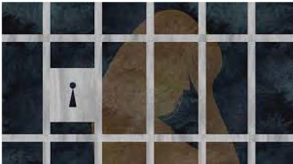
هنر زندانی گمنام